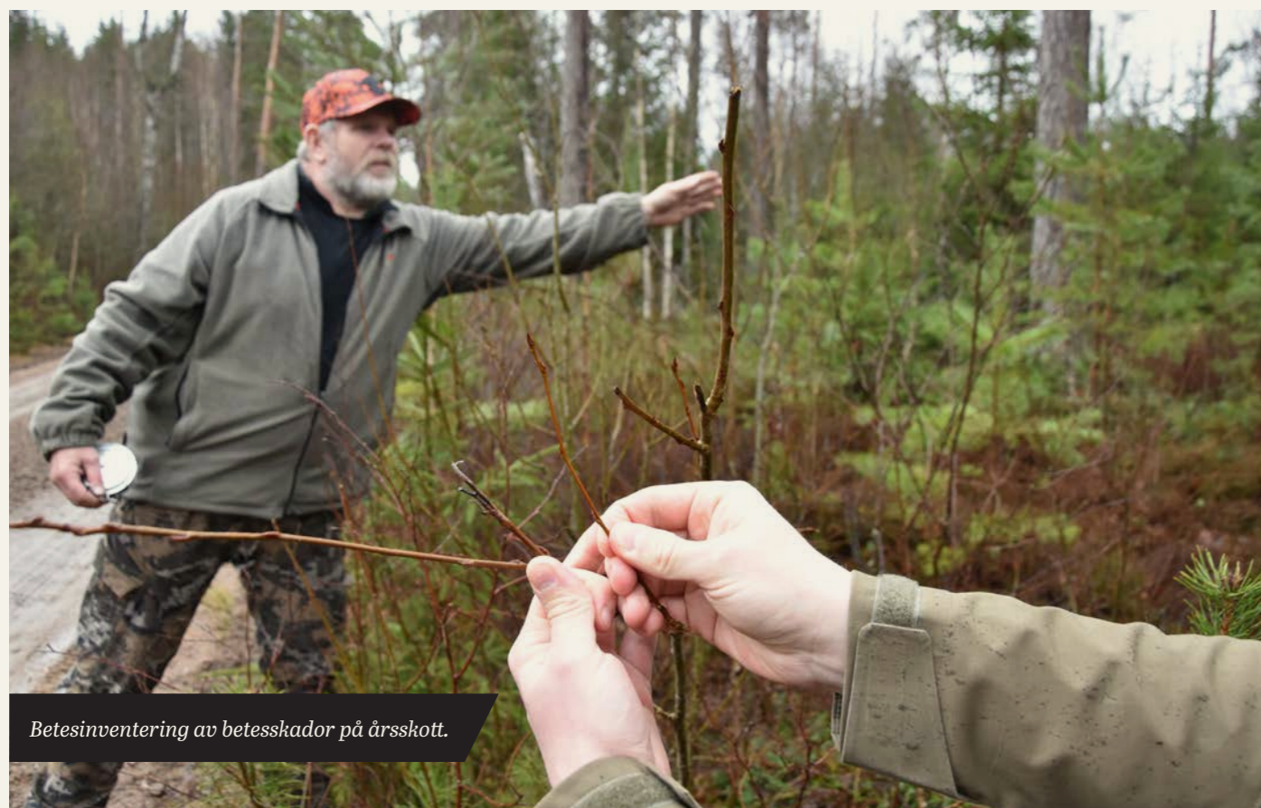
Betesinventering av betesskador på årsskott.