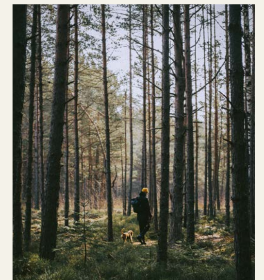
Bilden har inget med artikelns innehåll att göra.