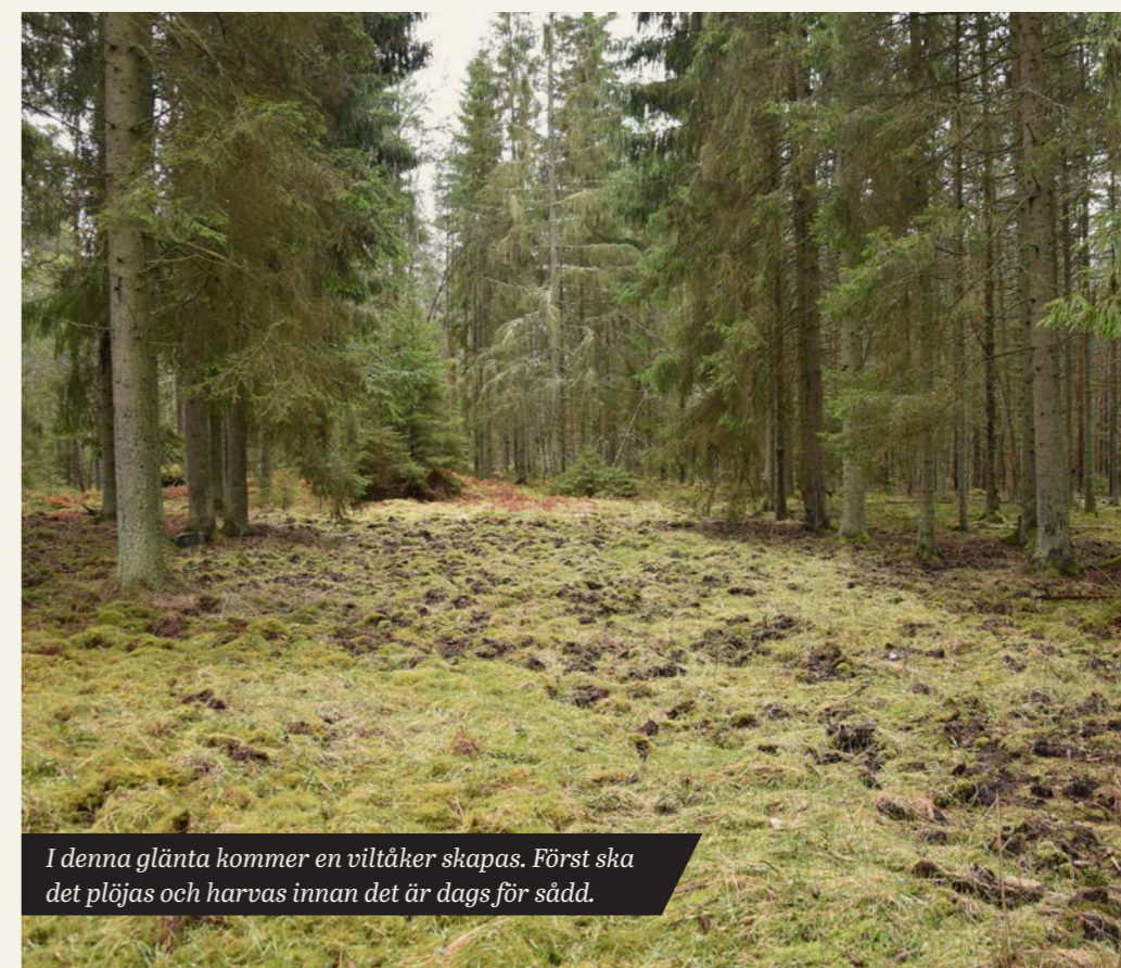
I denna glänta kommer en viltåker skapas. Först ska det plöjas och harvas innan det är dags för sådd.

Ett vattenhål på fuktiga marker gör att vattnet håller längre under torra perioder. Tänk på att skapa fasta och bra kanter runt vattenhållet så att inte djuren går ner sig.