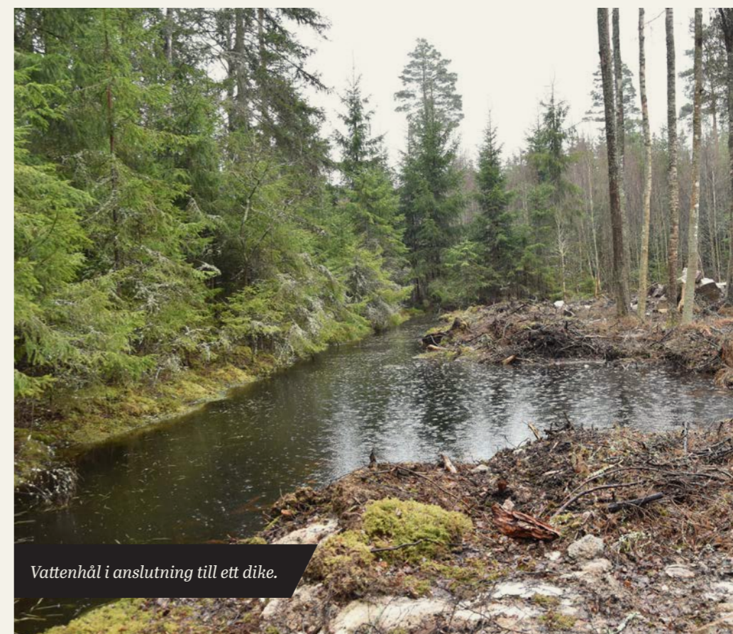
Vattenhål i anslutning till ett dike.